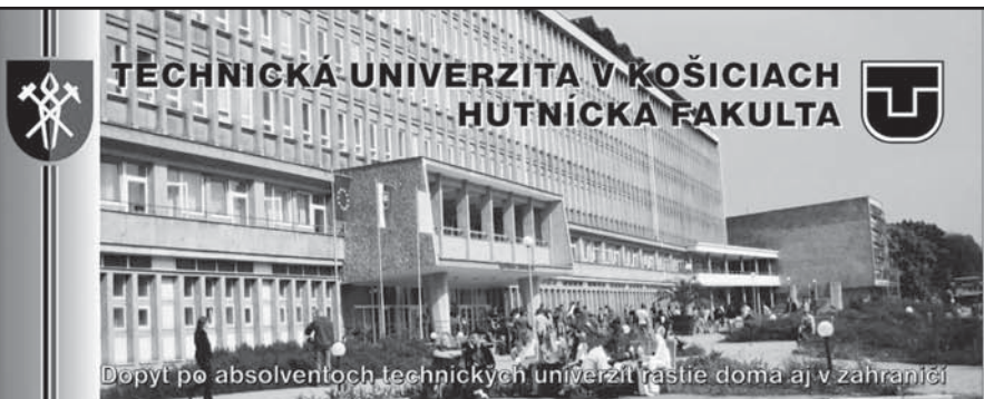
Dopyt po absolventoch technických univerzít rastie doma aj v zahraničí

Hutnická fakulta TU v Košiciach ponúka absolventom stredných škôl s maturitou možnosť 3-stupňového vysokoškolského štúdia.