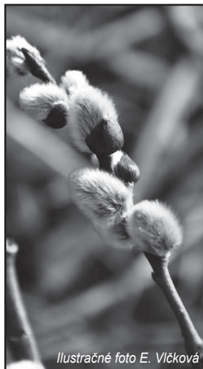
Ilustračné foto E. Vlčková

svojej histórie získala. Prvé dva lisy majú byť dodané do konca tohto roka, ostatné v priebehu roku 2012. Vulkanizačné lisy VL 100“ patria medzi najväčšie lisy v pro-