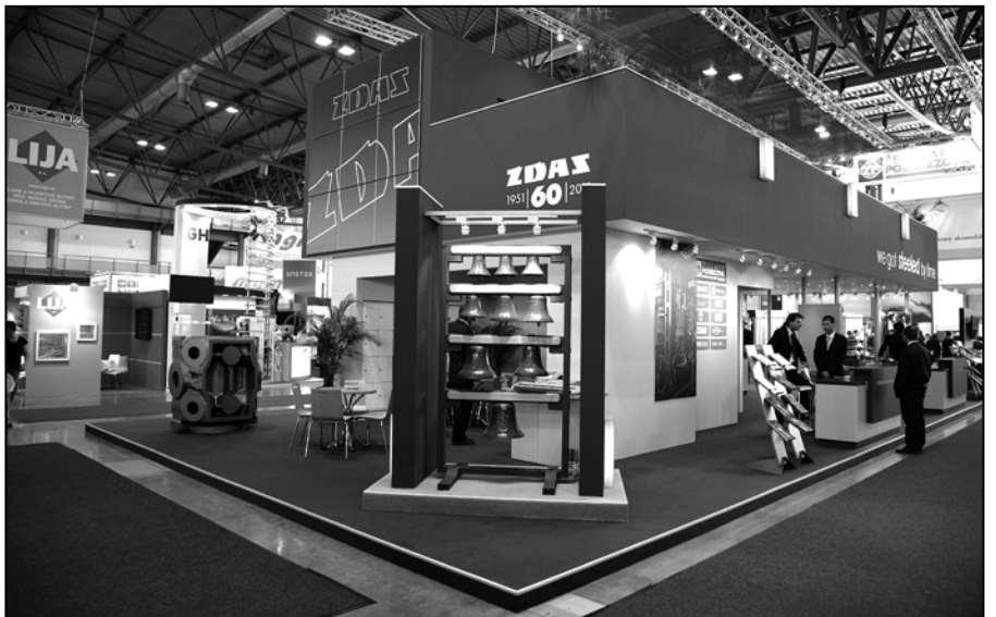
V roku 60. výročia svojho vzniku spoločnosť ŽDAS predstavila pamätnú zvonkohru