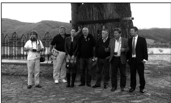
Foto na pamiatku pred Korvinovej lipy