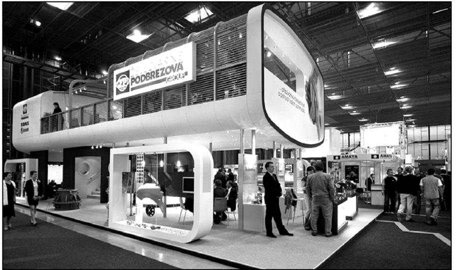
Expozícia v roku 2006 dostala novú tvár a tento dizajn pretrvával až do roku 2011

V roku 2012 (prvýkrát v roku 2003) sa naše spoločnosti predstavili na MSV Brno už