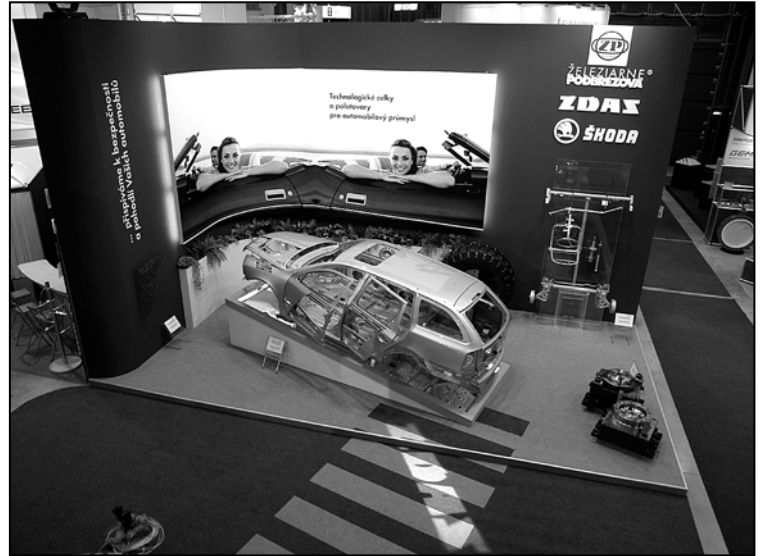
Pohľad na výrobky ŽP GROUP pre automobilový priemysel – expozícia z roku 2005