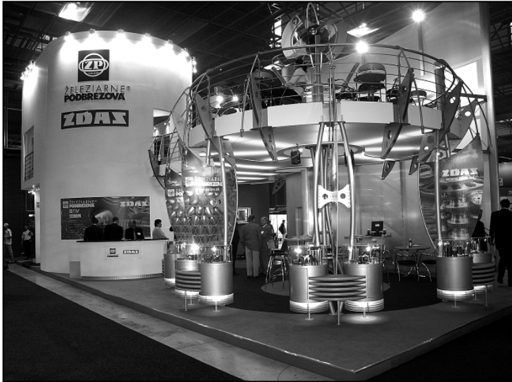
Prvá spoločná expozícia ŽP GROUP v roku 2003