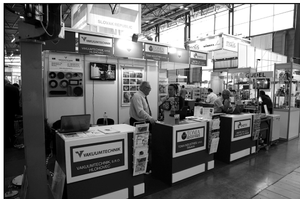
Oficiálna expozícia Slovenskej republiky