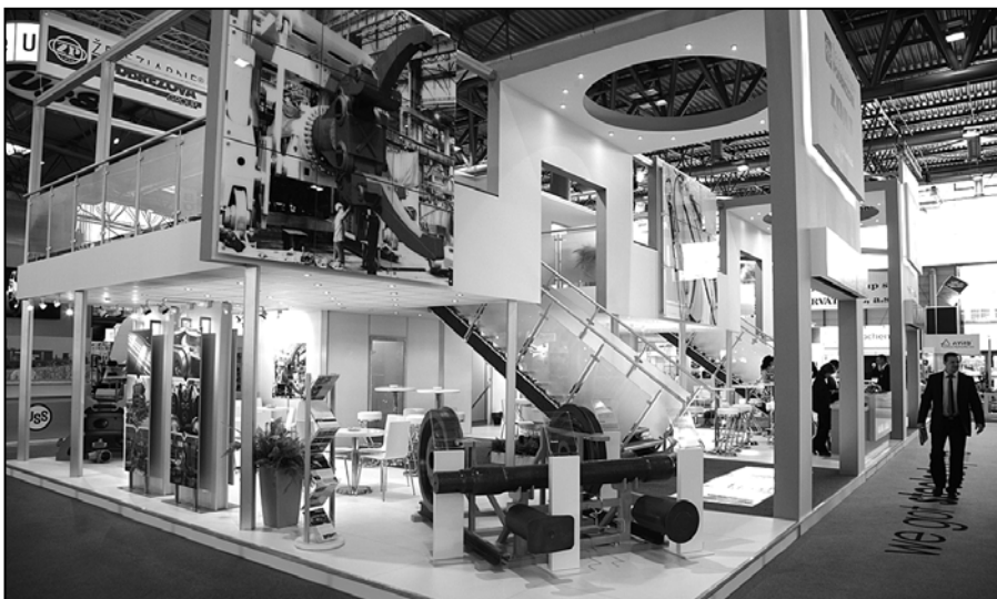
Aj tohtoročný stánok ŽP GROUP zaujal vkusným, jednoduchým a funkcionalistickým riešením a nápaditou grafikou

Na tému internet verzus veľtrh už bolo toho veľa napísané aj pohovorené. Internet napomáha obchodovaniu, ale