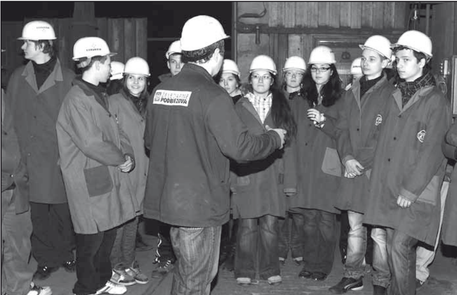
Nahliadnúť do výrobného procesu materskej spoločnosti mali možnosť žiaci druhého ročníka Súkromného gymnázia ŽP 3. marca 2011. Na programe bola návšteva „najatraktívnejších“ prevádzkarňí, elektrooceliarne a valcovne bezvíkových rúr. Exkurzia žiakom obohatila vedomosti z fyziky a chémie. Nezabudnuteľné sú aj zážitky z výroby a spracovania ocele.