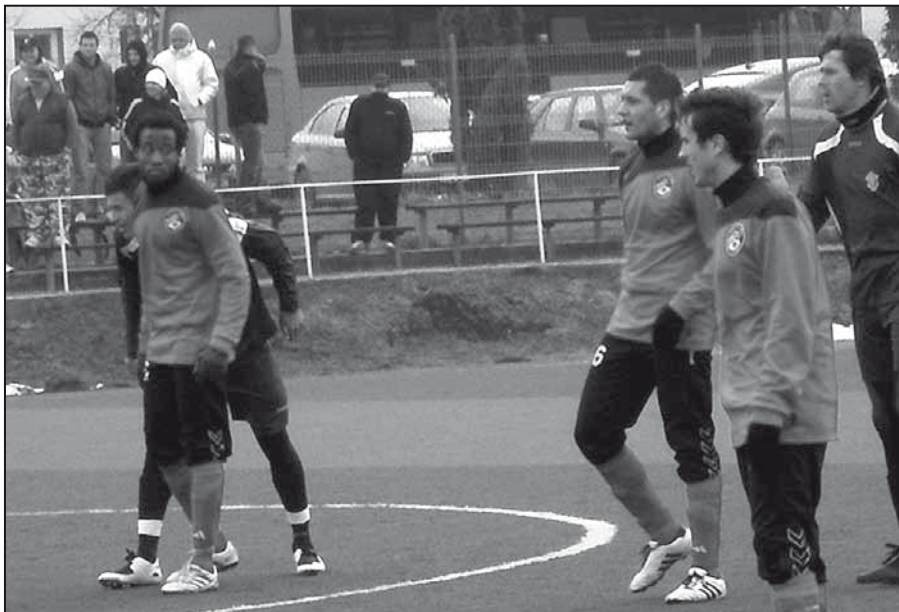
Jarnú časť futbalových zápolení začínajú muži v Lipanoch už zajtra.