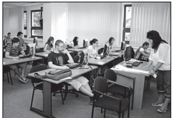
Aj tohtoročný kemp bol pre účastníkov prínosom.

z oblasti informačných technológií. Myslím si, že nikto z nich