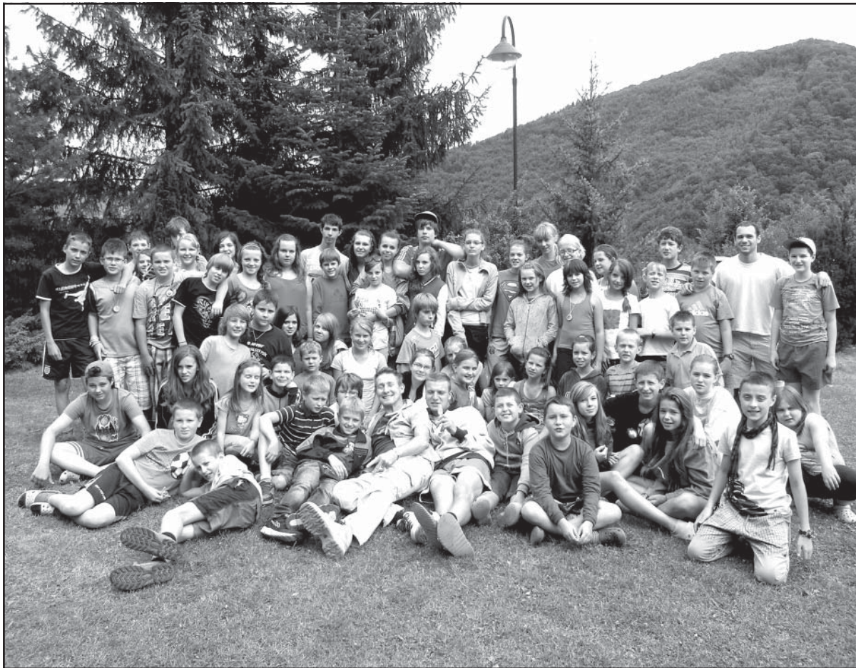
Spoločná foto z tohtoročného prázdninového tábora