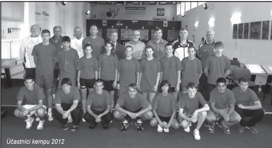
Účastníci kempu 2012