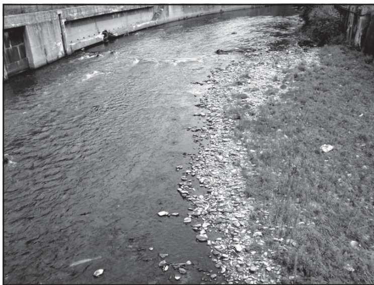
Sucho sa podpísalo aj na rieke Hron.