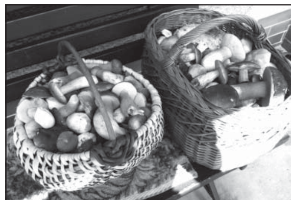
Hoci sa momentálne sucho prejavilo aj v horách, huby rástli a určite ešte rást budú.