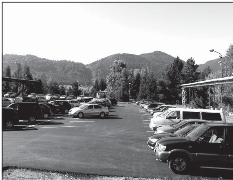
Pohľad na vynovené parkoviisko v novom závode.