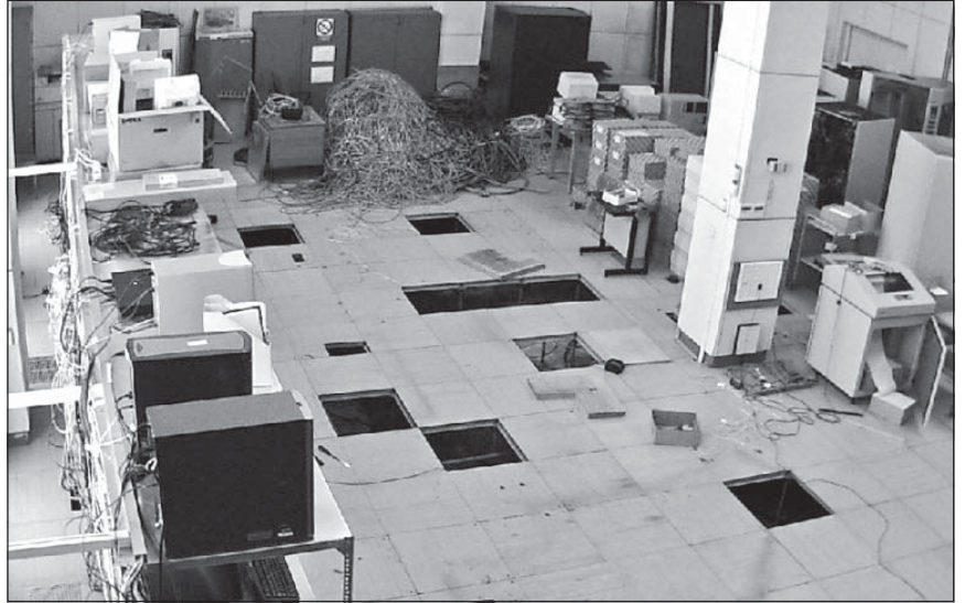
Demontáž mainframe IBM...