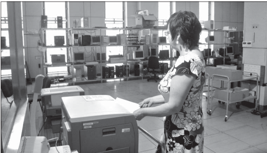
Pohľad do sály PC