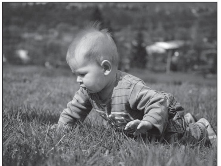
Nebezpečenstvo číha aj v tráve.

naša anketa ■ naša anketa ■ naša anketa ■ naša anketa ■ naša anketa