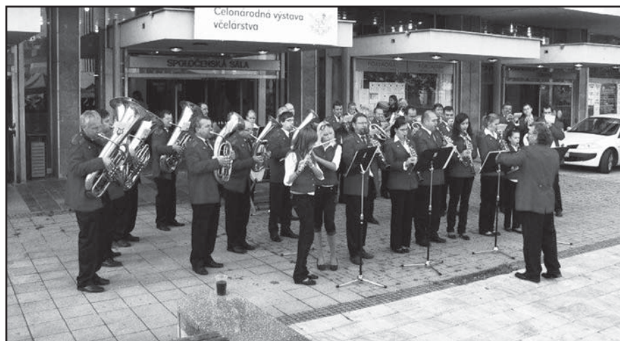
Počas uplynulého víkendu bolo v Banskej Bystrici rušno a okrem tradičného Radvanského jarmoku prilákala do krajského mesta zvedavcov aj Medzinárodná výstava včelárov, ktorá sa konala v priestoroch domu kultúry. Už prvé tóny úvodnej skladby našej dychovej hudby upútali pozornosť a tak sa ich hodinový koncert niesol v znamení obdivu a dobrej nálady.

Napriek dobrým septembrovým číslam budem opatrný. Kríza sa totiž nekončí a naopak, znova začínajú vyrábať fabriky, ktoré boli počas letných mesiacov odstavované. Objem dopytu určite nie je porovnateľný s ponukou výrobcov. ok