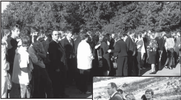
V súčasnosti študuje 287 žiakov v SSOŠH a 140 v SG ŽP.