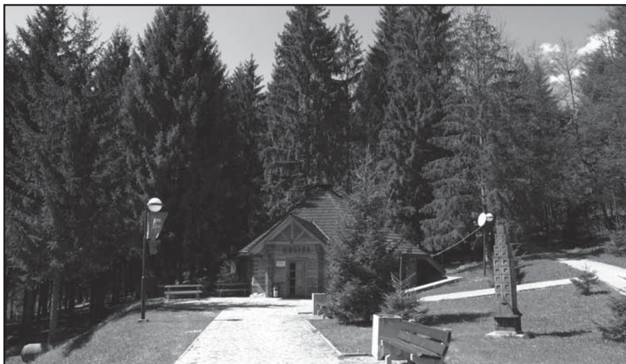
Prostredie na oddych ako stvorené.