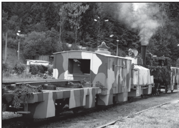
V Hronci bol pristavený pancierový vlak Štefánik.

Dvojňové celoslovenské oslavy 65. výročia Slovenského národného povstania vyvrcholili 30. augusta v Lesníckom skanzene vo Vydrovskej doline. Jednak krásne slnečné počasie, ale pre-