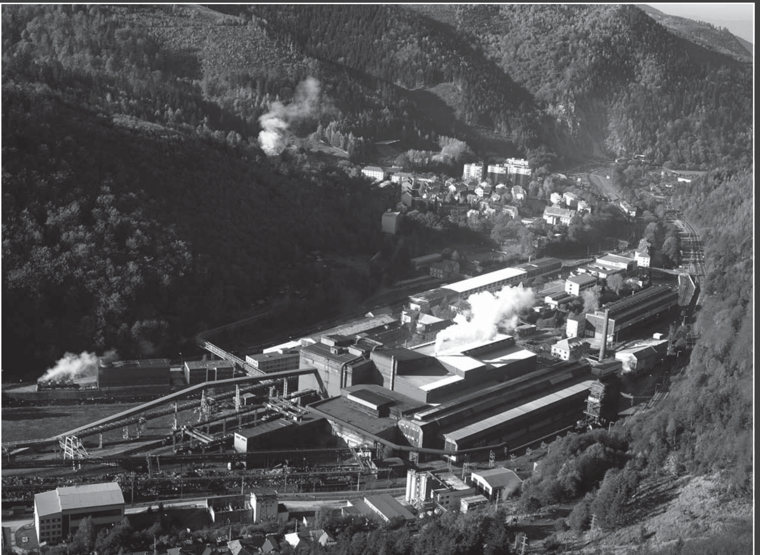
...a súčasný pohľad na Železiarne Podbrezová a.s.