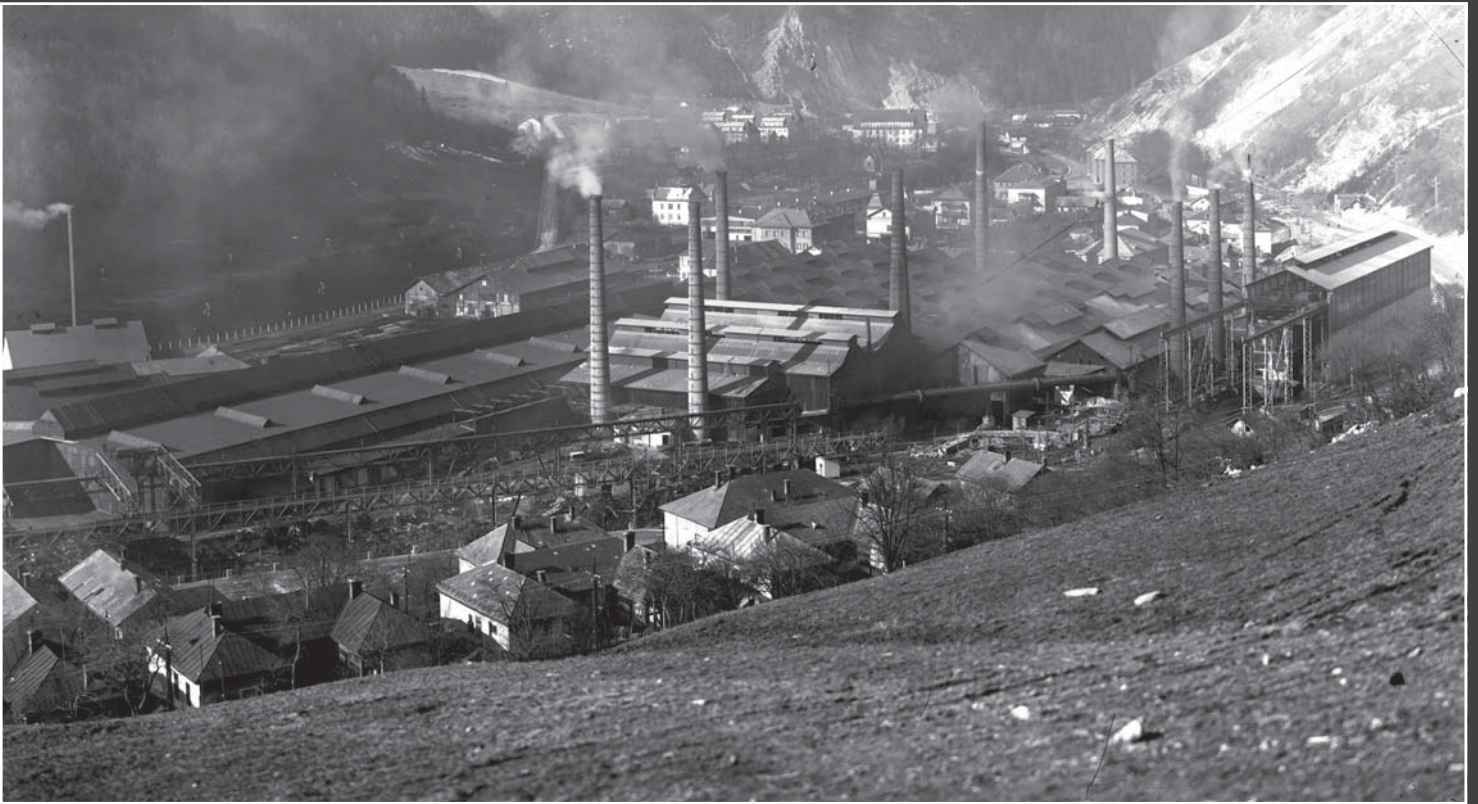
Archívny pohľad na Švermova železiarne, národný podnik, Podbrezová v roku 1950...