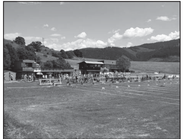
Strelnica Šimáň počas 3. kola Viessmann pohára