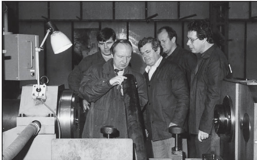
Zhodnotenie ceny bezšvíkových rúr sľubovalo zavedenie výroby hydraulických rúr – prvá skúška sa uskutočnila 19. marca 1998

Sto sedemdesiat rokov existencie zaraďuje podbrezovské železiarne medzi najstaršie firmy na Slovensku. Prešli 19., 20. a ocitli sa v 21. storočí. Počas tohto obdobia sa vystriedali roky úspechov i neúspechov, niekoľkých svetových hospodárskych kríz, dvoch svetových vojen a štyroch zmien štátneho usporiadania – od monarchie až po demokraciu. Významné udalosti zásadnou mierou ovplyvňovali aj vnútorné dianie. Železiarne sa v ich priebehu menili, zdokonaľovali, rozširovali a nakoniec transformovali na mini hutu.