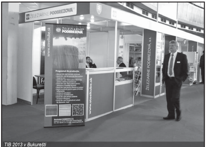
TIB 2013 v Bukurešti