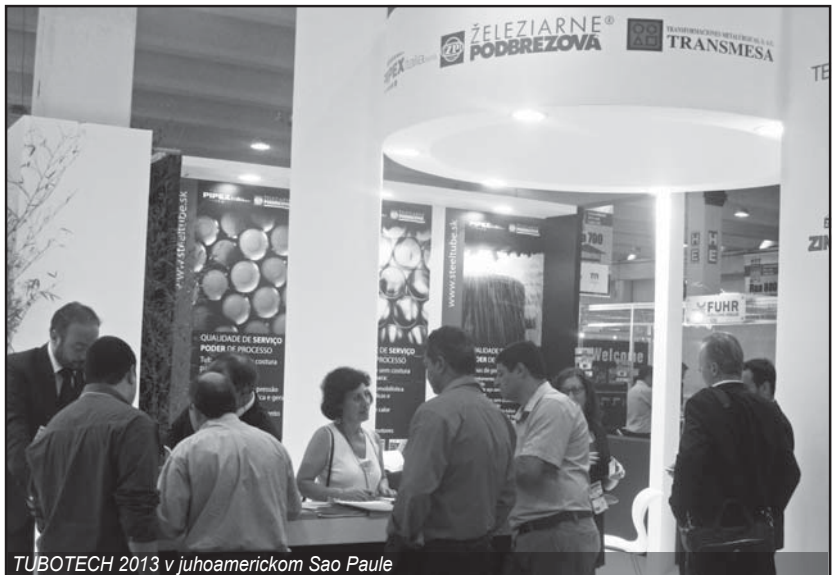
TUBOTECH 2013 v juhoamerickom Sao Paulo

V dňoch 16. až 19. októbra 2013 sa v Bukurešti konal Medzinárodný technický veľtrh TIB 2013. Veľtrh sa orientuje na prezentáciu inovačných technológií v rôznych oblastiach priemyselnej výroby. V rámci slovenského národného stánku sa predstavila aj naša spoločnosť. Slovenskú účasť s finančným príspevom Minis-