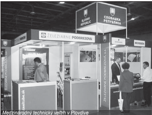
Medzinárodný technický veľtrh v Plovdive

V dňoch 16. až 19. októbra 2013 sa v Bukurešti konal Medzinárodný technický veľtrh TIB 2013. Veľtrh sa orientuje na prezentáciu inovačných technológií v rôznych oblastiach priemyselnej výroby. V rámci slovenského národného stánku sa predstavila aj naša spoločnosť. Slovenskú účasť s finančným príspevom Minis-