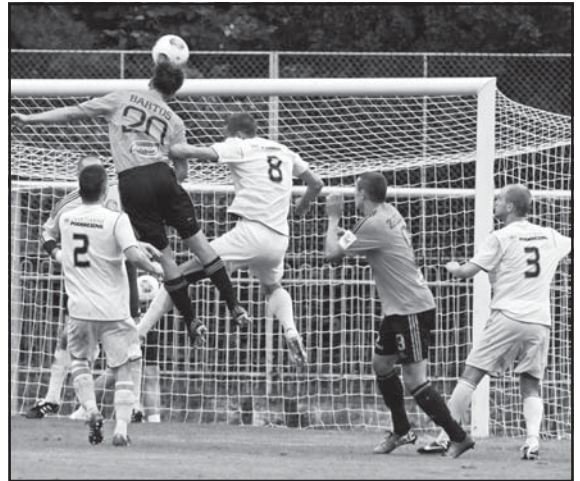
Pred poslednými jesennými zápasmi objektívom I. Kardhordovej

Po sérii troch zápasov na ihriskách súperov sme nastúpili na umelej trávě na Skalici, kde prvých 28. min. sa hral nezáživný futbal s množstvom nepresností. Osem minút pred koncom polčasu sme hostí zatlačili a po peknej akcii z ľavej strany, po centri