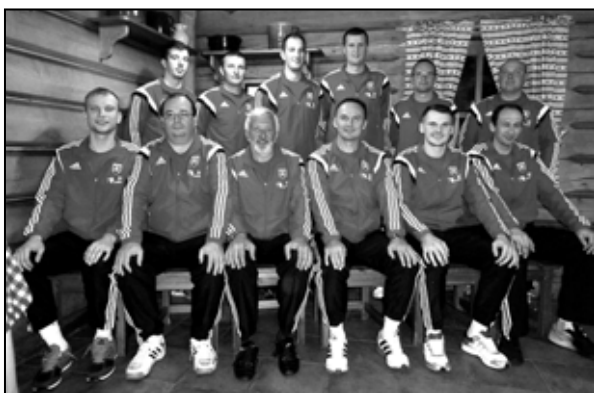
V SP 2014 skončili muži na 5. mieste

Mužské a ženské družstvá Kolkárskeho oddielu ŽP Šport sa 1. - 4. októbra zúčastnili na medzinárodných podujatiach, ktorými boli Svetový pohár mužov v rakúskom Harde a Koblachu, resp. Európsky pohár žien v chorvátskom Varaždine. Obidve družstvá sa však bohužiaľ vrátili