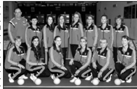
V EP 2014 obsadili ženy 6. miesto