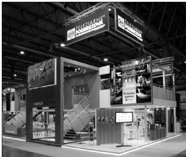
Stánok ŽP GROUP