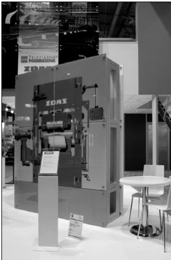
Schéma dvojvalcovej kosouhlej rovnačky na tyče a rúry XRK 2 – 130, exponát, ktorý bol nominovaný na Zlatú medailu MSV 2014.