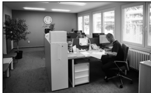
Pohľad do zmodernizovaných priestorov spoločnosti