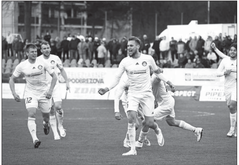
Radost domácich z gólu v 72. minúte v zápase s Duklou.