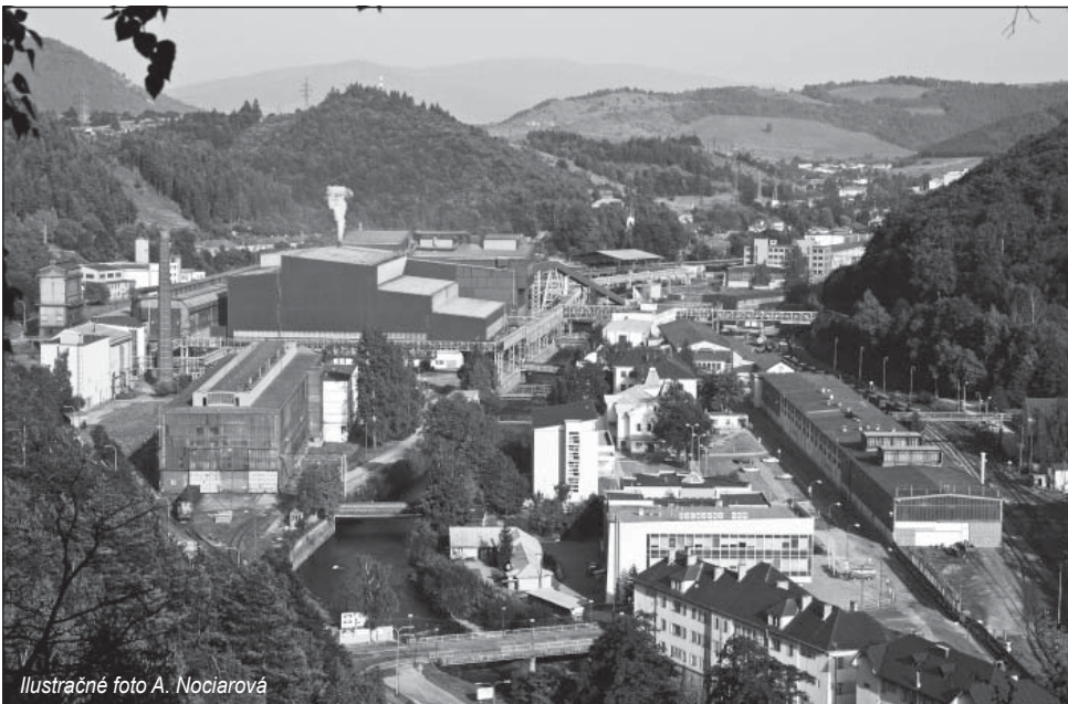
Ilustračné foto A. Nociarová