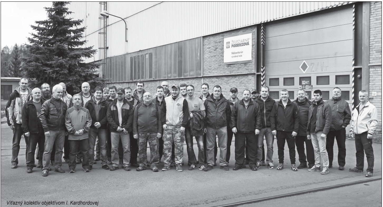
Vítaný kolektív