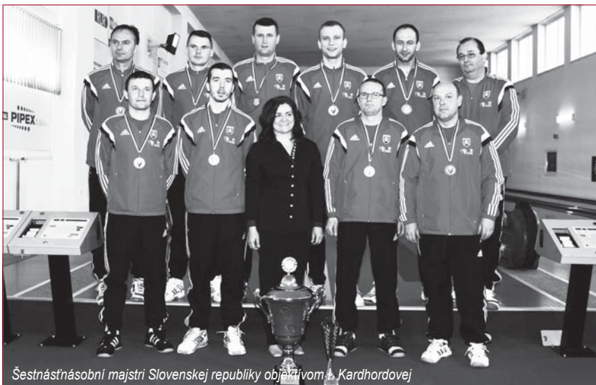
Šestnásťnásobní majstri Slovenskej republiky