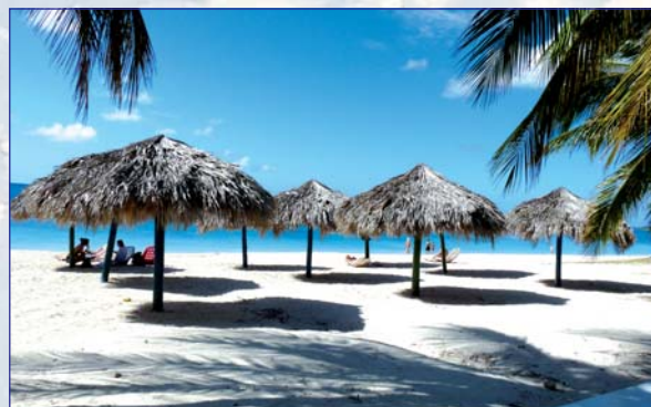
Pláže na Kube sa slovami neopisujú

Hlavné mesto sa dá v skratke opísať niekoľkými slovami – nespočetné množstvo pravouhlých ulíc so starými ošarpanými domami, pred ktorými vysedávajú pohodoví Kubánci. Čo je u nás vchodom do paneláku, tu je u nich prvou izbou, v ktorej je posteľ, zapnutý televízor a pohoda. Nie tak