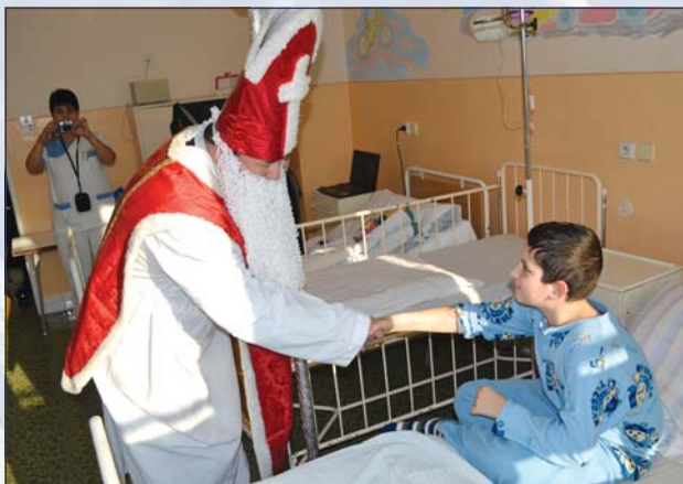
Mikuláš rozdával darčeky