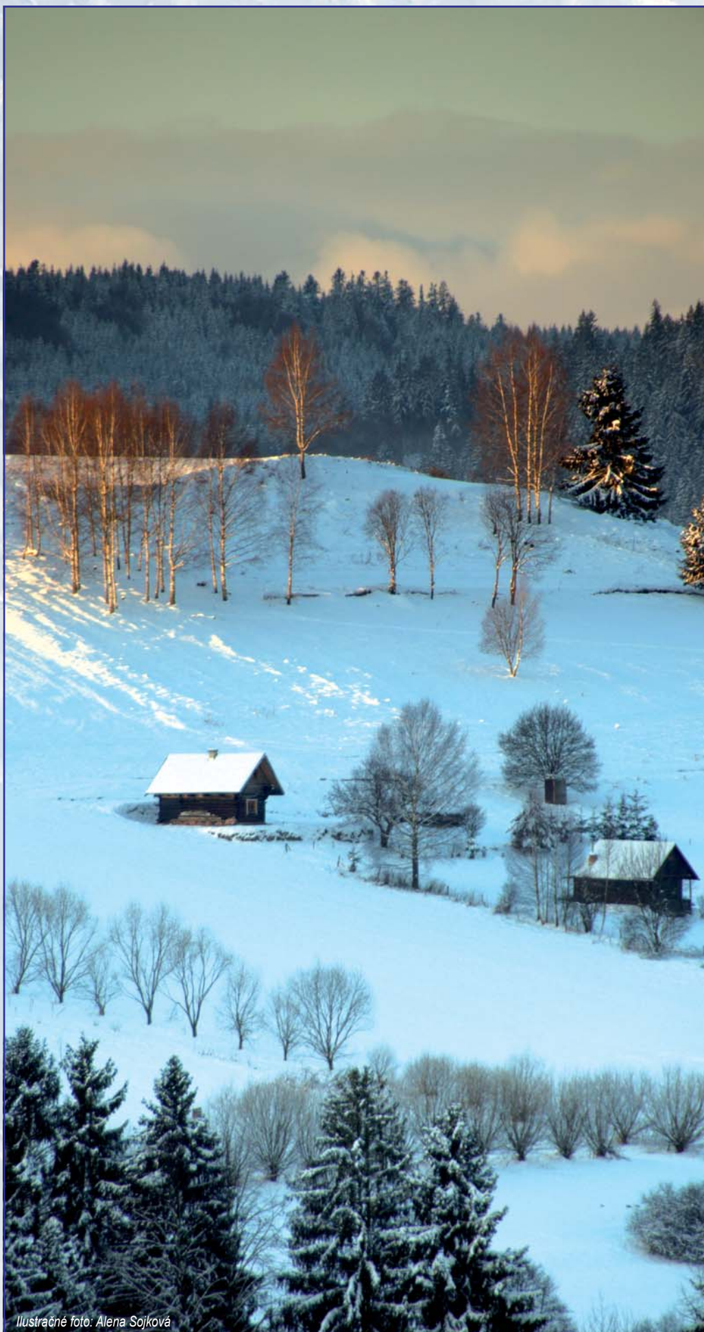
Ilustračné foto: Alena Sojková