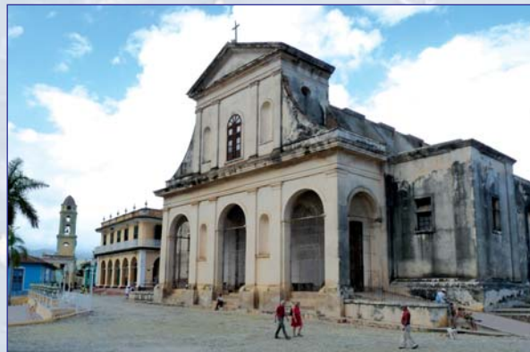
Mestečko Trinidad ponúklo výlet do histórie

Pred tým, ako vycestujem do neznámej krajiny si rád vyhľadám množstvo informácií o minulosti, kultúre, či úrovni služieb, no o Kube som tento raz nevedel takmer nič. A ani som vlastne nechcel, veď o Kube toho z dejín viem celkom dosť, tak aspoň otestujem, či je Kuba skutočne posledným (a zároveň i prvým) komunistickým štátom na západnej pologuli našej planéty so všetkým, čo si matne pamätám z dôb svojho detstva, keď aj moja vlasť žila v rovnakom politickom zriadení. Tešil som sa na staré americké autá, ktoré som považoval za raritu a skôr