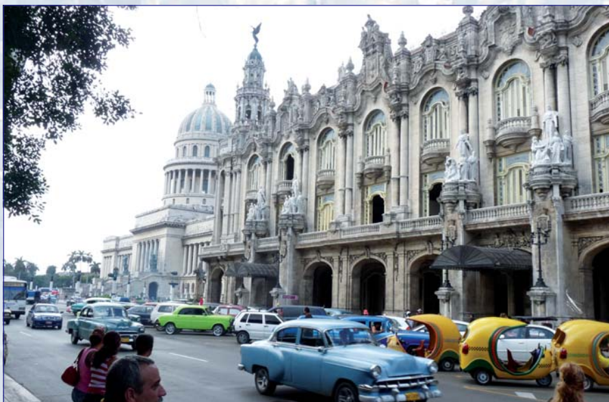
Centrum Havany ponúkalo množstvo atraktívnych pohľadov - v pozadí známy El Capitolio

Ubytovanie sme mali rezervované len na dve noci v starej časti Havany. Cestou do hotela padlo na čelné sklo niekoľko kvapiek dažďa, no taxikár nás ubezpečil,