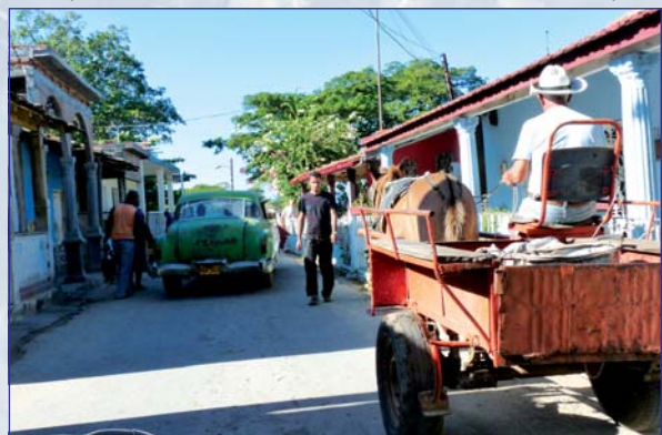
Cestou na pláž ...

zínsko a Azerbajdžan. Keď sa už zdalo, že nám nič nebráni v ceste, predsa len prišlo k ďalším zmenám, úpravám termínov, skracovaniu celkového času, až sme uznali, že v tomto roku už žiadny veľký cestovateľský sen neuskutočnime, iba ak by sme spojili príjemné s užitočným... Kuba! Rozhodla „lacná“ letenka, klimatické podmienky a sen.... veď kto nespíva, že navštívi tento ostrov slobody?