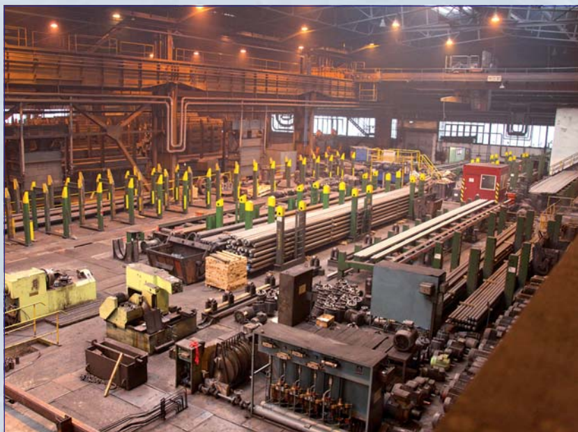
Vo valcovni rúr bolo v tomto roku realizovaných niekoľko technologických zmien

Aj napriek negatívnym trendom vo výrobe a spotrebe bezšvíkových rúr, ktoré sa objavujú v posledných mesiacoch tohto roka verím, že situácia na trhu sa v priebehu prvého kvartálu roka 2013 stabilizuje a na konci roka 2013 budeme môcť konštatovať splnenie zámerov stanovených na začiatku v obchodnom, aj finančnom pláne. V mene výrobného úseku, ako aj v mene svojom, ďakujem všetkým zamestnancom výrobného úseku a všetkým zamestnancom akciovej spoločnosti Železiarne Podbrezová za úsilie vynaložené pri plnení výrobných úloh počas tohto roka. Želám všetkým zamestnancom a ich rodinným príslušníkom príjemné prežitie vianočných sviatkov v kruhu svojich najbližších, veľa pevného zdravia, šťastia a úspešný vstup do nového roka 2013.