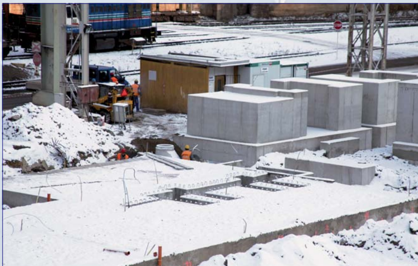
Významnou investíciou je rekonštrukcia odprášenia EAF a LF pece.

Výpadok zákaziek na predaj presných rúr sme v priebehu tretieho kvartálu začali kompenzovať vyšším nárborom valcovaných rúr. Vďaka zvýšenému úsiliu obchodníkov, sme výrobu na predaj valcovaných rúr v treťom kvartáli zvýšili, v porovnaní s priemerom prvého a druhého kvartálu, približne o 7 percent. Vyvrcholením tohto úsilia bolo dosiahnutie rekordnej výroby na predaj a rovnako aj rekordného vyexpedovaného objemu valcovaných rúr v októbri. Navýšením predaja valcovaných rúr bolo umožnené najmä získaním zákaziek v zámorí, čo sa prejavilo aj rekordným objemom výroby UV lakovaných rúr v októbri. S prichádzajúcim koncom roka pociťujeme znížený objem zákaziek aj vo valcovaných rúrach, čo sa pre-