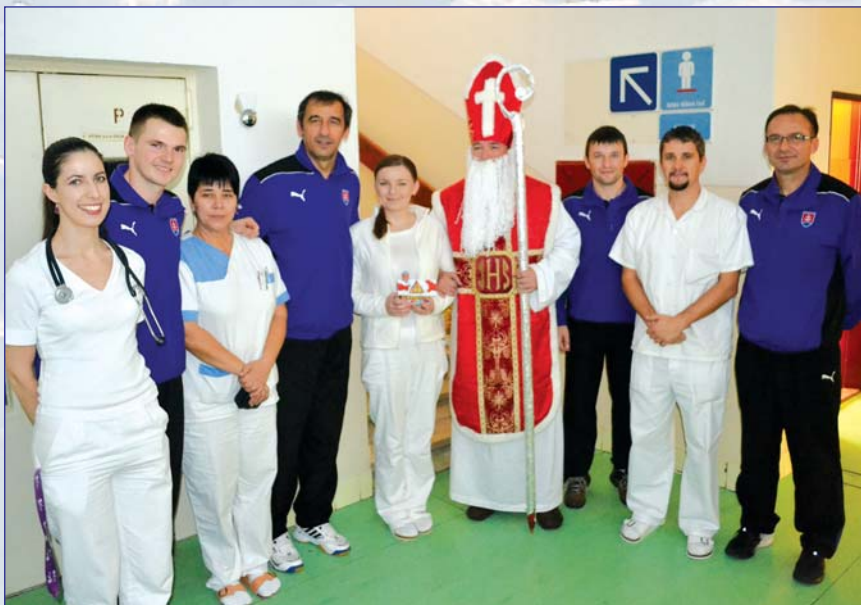
Kolkárski majstri sveta s personálom detského oddelenia