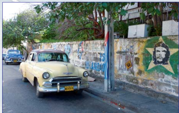
Heslá, nápisy, monumenty ... Kuba je pyšná na svojich hrdinov na každom kroku