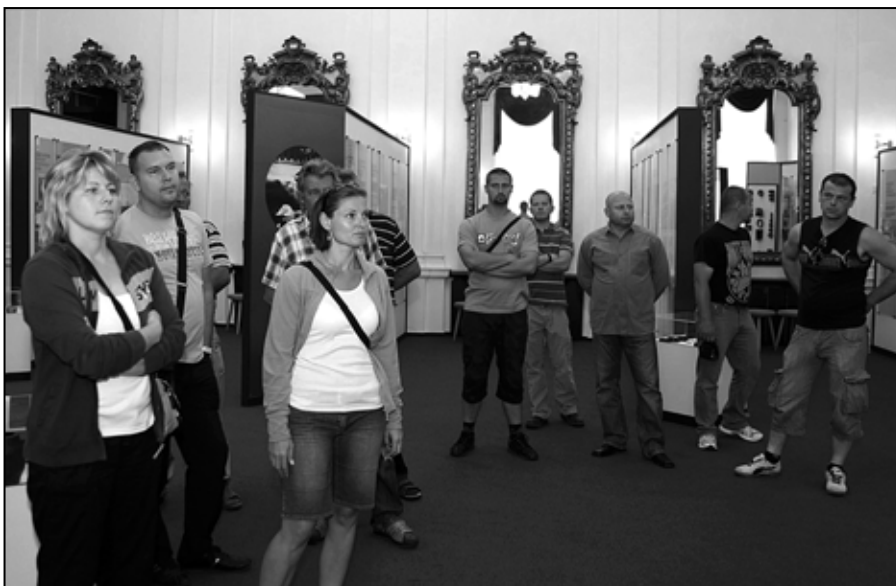
Dňa 11. júla navštívila ŽP prvá skupina.