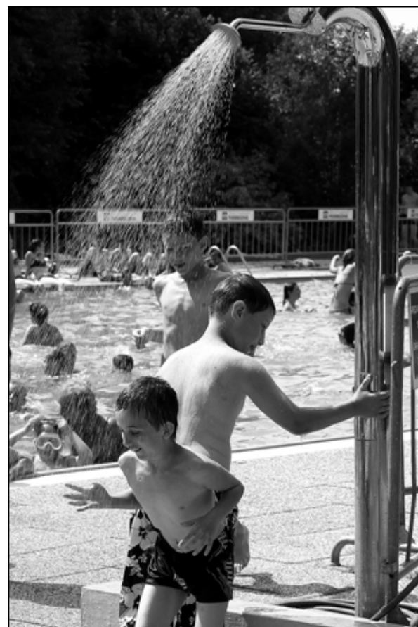
Podbrezovské kúpalisko poskytuje pohodu a relax.

Bravčová krkovička na cesnaku, zem., cvikla Námornické hovädzie mäso, slovenská ryža, šalát Bageta salámová so šalátom