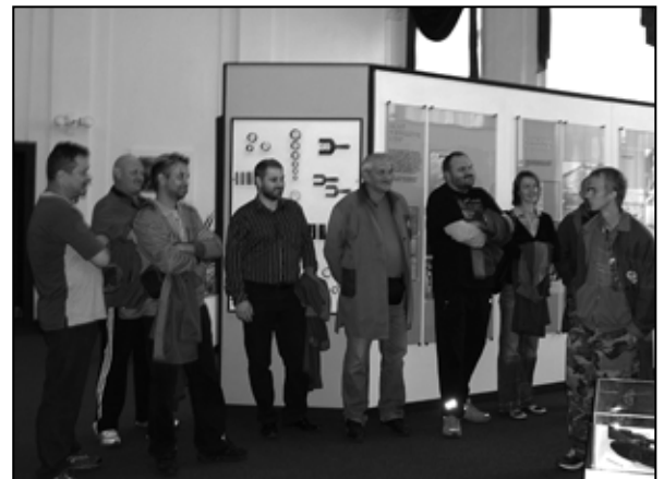
Dňa 18. júla navštívila ŽP druhá skupina.

sa s dlhoročnou tradíciou regiónu Podbrezovej a hutníckeho závodu, ale najmä s procesom váženia, preberania, „druhovania,“ skladovania a ďalšieho nakladania s ocelovým šrotom. Odborníci zo vstupnej kontroly, šrotového poľa a oceliarne nás upozornili na najčastejšie nedostatky a chyby, ktorých sa pri dodávkach dopúšťame, ale aj s neustálym trendom zlepšovania kvality. V súčasnosti sa hod-