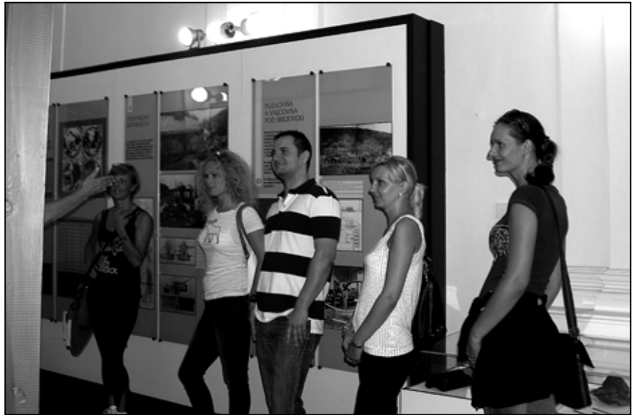
Oboznámili sa aj s našou históriou.

ločnosti Trexima sa na úvod návštevy oboznámili v Hutníckom múzeu s dejinami podbrezovských železiarní. Nasledovala prehliadka výrobných prevádzkarní oceliarne, valcovne bezšvíkových rúr a ťahárne rúr a oboznamovanie sa s konkrétnymi profesiami zaradenými do národnej sústavy povolání v zmysle projektu SK ISCO 08. Svoju návštevu ukončili prehliadkou Hradu Ľupča. ok