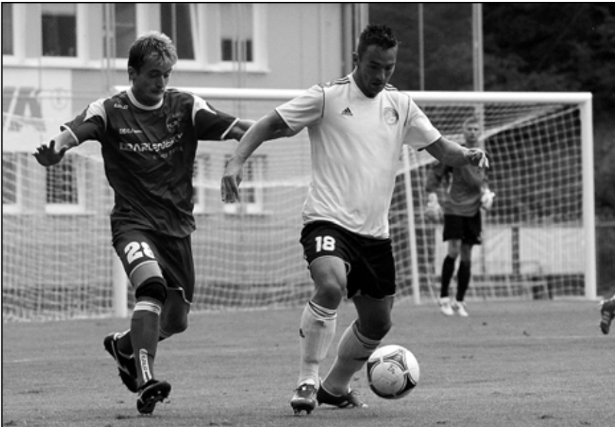
Prvý jesenný zápas

Na futbalovom ihrisku v Podkoniciach sa za tropického letného počasia uskutočnil 7. júla futbalový turnaj, zorganizovaný firmou CONFAL. Do bojov o najvyššie priečky sa zapojilo sedem zúčastnených tímov. Systémom každý s každým bol stanovený hrací čas jedného zápasu na 15 minút. Svojich zástupcov v turnaji mali spoločnosti - ŽP EKO QELET a.s., ADA WASTE, s.r.o., ELEKTRO RECYCLING, s.r.o., SCRAPMETAL s.r.o., VRP s.r.o., P + K s.r.o. a domáci Confal a.s.