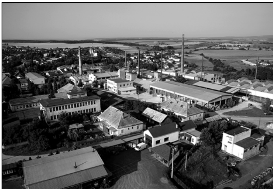
Letecký pohľad na Žiaromat Kalinovo.