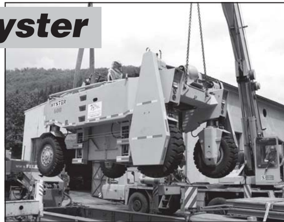
Skladanie vozidla v priestoroch ŽP a.s., po jeho dodaní 21. mája 2008.

rickom prístave Baltimore, loďou prepravené do nemeckého prístavu Hamburg a odtiaľ dopravené špeciálnym kamiónom priamo do Podbrezovej. Do našej spoločnosti dorazilo 21. mája 2008.