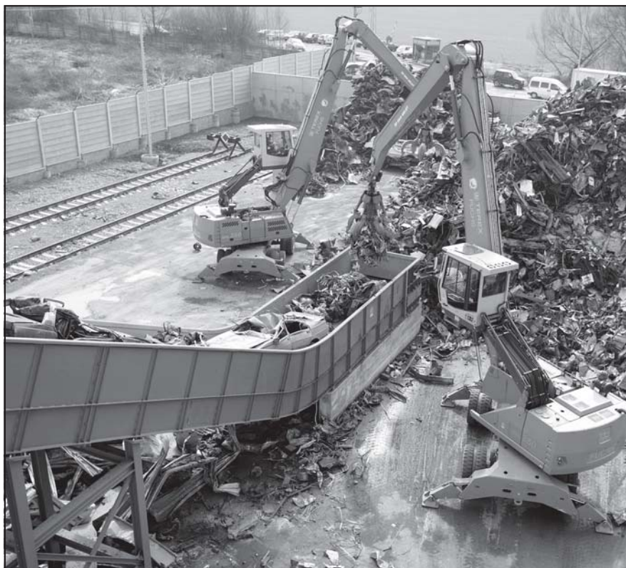
V Hliníku nad Hronom je najmodernejšie spracovacie centrum na vysokoefektívne zhodnocovanie autovrakov a kovového odpadu.

Závod významnou mierou prispieva k tomu, aby bolo Slovensko pripravené splniť záväzky vyplývajúce zo smerníc Európskej únie, ohľadom spracovania vyradených autovrakov. -ok-