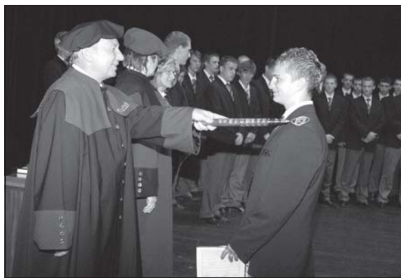
Atmosféra počas slávnostného aktu bola skutočne sviatočná.