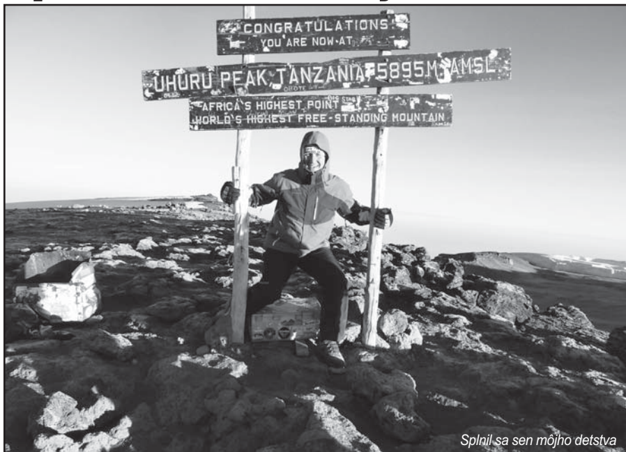
Splnil sa sen môjho detstva

ako sa zotmelo, ochladilo sa na zhruba desať stupňov. Unavení po úmornej ceste sme zafahli. Na druhý deň ráno už pred hotelom stál džíp, sprievodca a šofér v jednej osobe, kuchár, naložená kuchyňa, kemp a odštartovali sme smer safari, po prasných cestách do Serengeti. Pred zotmením sme prišli do kempu, kde sme nocovali v stanoch. Prvá noc v divokej prírode bola pre mňa zaujímavá. Kemp nebol oplotený a tak čudné za-