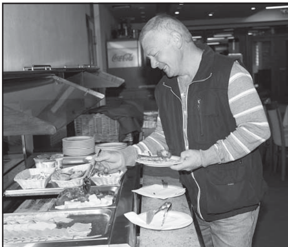
„Raňajky sú formou švédskych stolov a obed a večeru si vyberáme z troch ponúk.“