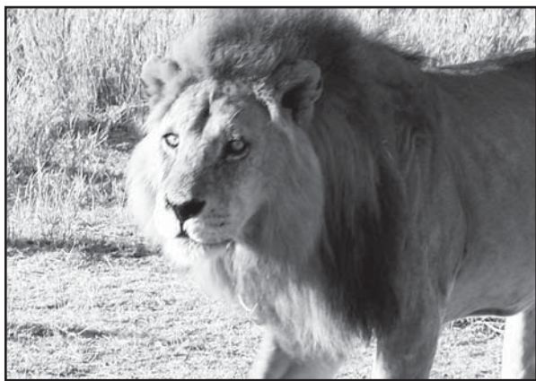
Pozdrav zo safari

rý nás mal prepraviť do Arushe, vzdialenej asi 250 kilometrov. Bližiac sa k Tanzánii pribúdali na ceste výmole a prach a navyše, zhruba šesťdesiat kilometrov pred cieľom nám odpadlo z mikrobusu koleso. Všetci sme sa pokúšali šoférovi pomôcť koleso upevniť. Nešlo to, chýbali súčiastky. Napokon sme to vzdali a presadli do okoloidúceho mikrobusu. V Arushi nás už čakal ďalší človek, ktorý držal tabuľku s našimi menami. Odviezol nás do hotela, kde sme prišli okolo šiestej, kedy na rovníku zapadá slnko a o siedmej už bola tma. Nakoľko Arusha sa nachádza v nadmorskej výške 1 400 m,