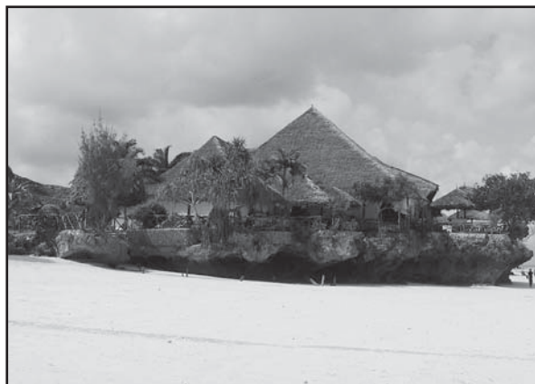
Zanzibarské pláže patria k najkrajším na svete

výjanie, mľaskanie a podobné zvuky vyvolali vo mne rôzne pocity. Ráno však naši sprievodcovia konštatovali, že to boli len hyeny a tých sa vraj netreba báť. Druhú noc sa k zvieracím zvukom pridal aj lev. Tri dni pobytu v Serengeti nás obohatili o množstvo zážitkov. Tam je krajina trávnatá a rovinatá a stretli sme sa s rôznymi voľne žijúcimi zvieratami. Fascinovali ma najmä levy. Navštívili sme aj Ngorongoro, kráter hlboký 600 metrov s plochou 260 km 2 . V tomto národnom parku žije okolo 30 tisíc zvierat – veľkých cicavcov - a tu sme nakoniec videli aj vzácne nosorožce.