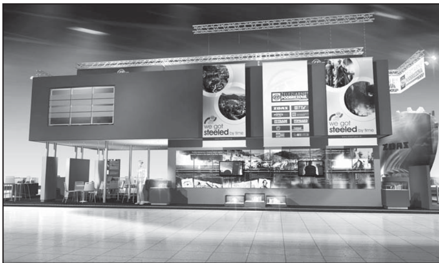
Expozícia ŽP GROUP sa bude niesť v znamení 170. výročia materskej spoločnosti