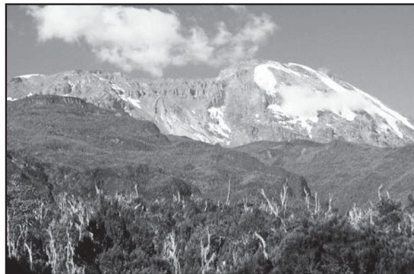
Kilimandžáro (5 895 m. n. m.)

Zo safari sme sa vrátili späť do Arushe. Ráno sme štartovali na Kilimandžáro. Uskutočnil sa briefing, na ktorom nás sprievodca informoval o tom, čo nás cestou čaká, skontroloval naše vybavenie (v prípade, že by nám niečo chýbalo, mohli sme to tam dokúpiť). My sme mali všetko a mohli sme ráno vyraziť. Pri vstupnej bráne sprievodca najal nosičov a tak sa naša skupinka rozrástla na desať nosičov, jedného kuchára a jedného sprievodcu. Dokúpili sa posledné drobnosti do kuchyne, potraviny nakládli do vriec a keďže jeden nosič nesmie niesť viac ako 20 kilogramov, odvážili ich a okolo dvanástej sme vyrážali smer prvý kemp. Ten bol vo výške 3 000 metrov a čakalo nás 4,5 hodiny cesty. Prvý úsek bol nenáročný, kráčali sme veľmi pomalým tempom, nakoľko sme sa museli postupne aklimatizovať. Výstup na Kilimandžáro nie je technicky náročný, nebezpečenstvom je skôr nadmorská výška, ktorej sa musí organizmus postupne prispôbovať. Do druhého kempu, vo výške 3 800 metrov, sme už nekráčali