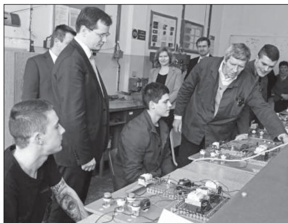
Minister si prezrel aj učebne praktického výcviku.