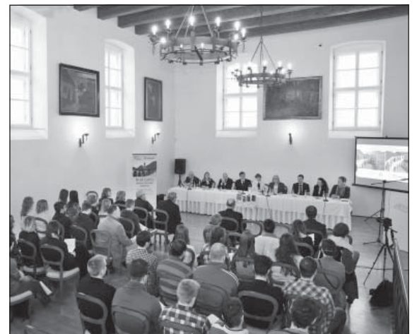
Pohľad na účastníkov otváracjej konferencie