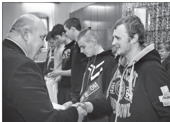
Pri preberaní ceny za účasť.

Kraja Vysočina sa súťaže zúčastnili aj dva zahraničné tímy zo Slovenska. Zatiaľ čo Vysočinu reprezentovali VOŠ a SPŠ Žďár nad Sázavou, Stredná odborná škola Jana Tiraya Velká Bíteš, Stredná priemyselná škola technická a automobilová Jihlava, VOŠ, OA a SOUT Chotěboř, Stredná priemyselná škola Třebíč, Stredná škola remesiel a služieb Moravské Budějovice a SPŠ a SOU Pelhřimov, zástupcovia zo Slovenska sa predstavili pod značkou Súkromná stredná odborná škola hutnícka Železiarne Podbrezová a Stredná odborná škola technická Tlmače. Súťažiaci