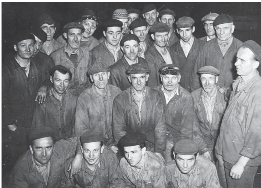
Náš kolektív v „bľachovej“.