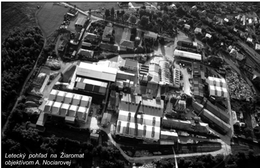
Letecký pohľad na Žiaromat