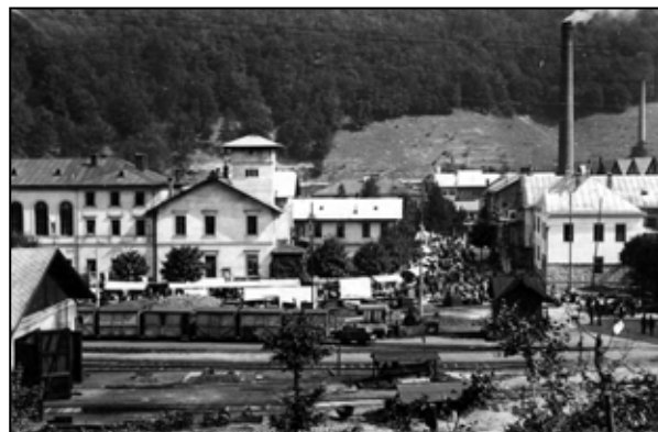
Podbrezovský jarmok na začiatku 20. storočia.

- Zamestnanci, ktorým vznikol nárok na jej vyplatenie, ju dostanú vo výplate za mesiac november 2012, pod mzdovým druhom 1414. Samozrejme, ako iné zložky mzdy, podlieha daňovému a odvodovému zaťaženiu. O.K.