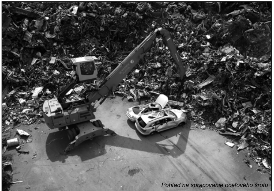
Pohľad na spracovanie oceľového šrotu