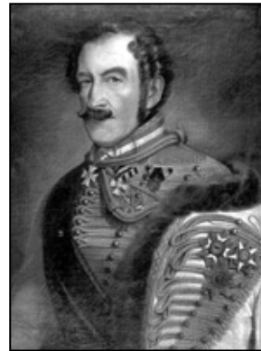
Ferdinand Juraj Coburg

sko a Nórsko, Rusko s Nemeckom, Rakúsko - Uhorsko s Portugalskom, Mexikom, Brazíliou a Španielskom. Rozsiahla sieť rodu vnašala do mysle mnohých osobností danej doby utopistické myšlienky na mierové