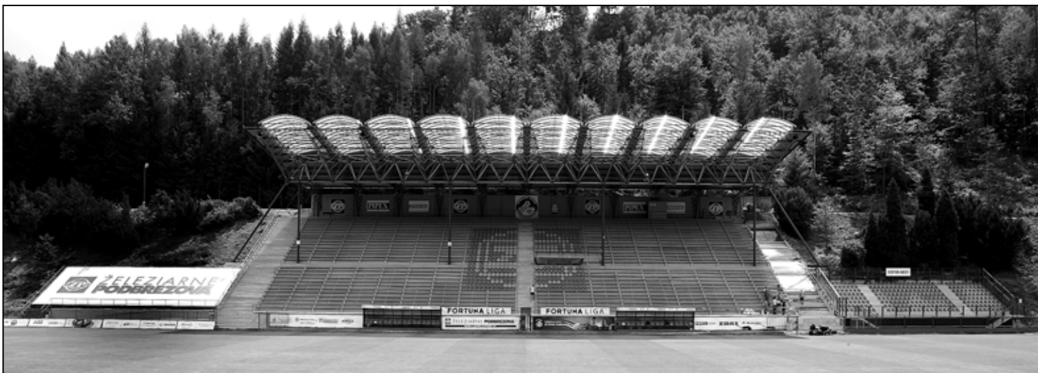
Futbalový štadión ŽP ŠPORT na Kolkárni pripravený privítať divákov prvého zápasu vo Fortuna Lige na domácej pôde – 19. júla 2014.