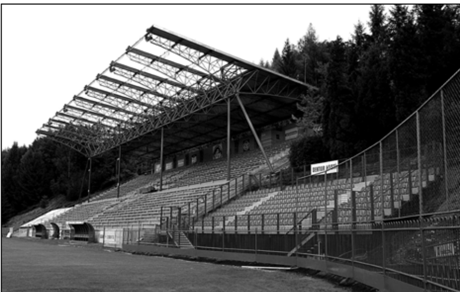
Sektor hostí má kapacitu 280 sediacich divákov, s osobitným vstupom na štadión – júl 2014.