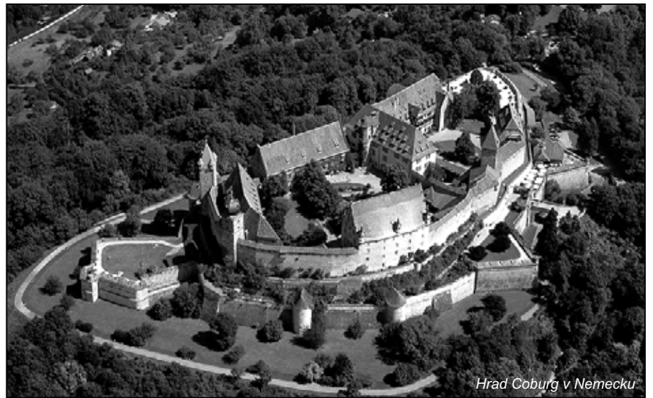
Hrad Coburg v Nemecku