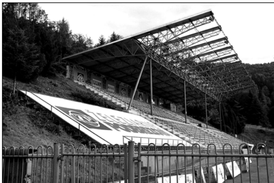
Po demontáži krytiny fixnej strechy - december 2013.