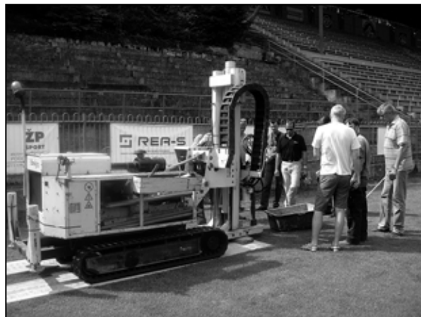
Vítacia súprava na dodatočné odvodnenie ihriska v oblasti tienenia hlavnej tribúny - august 2012.