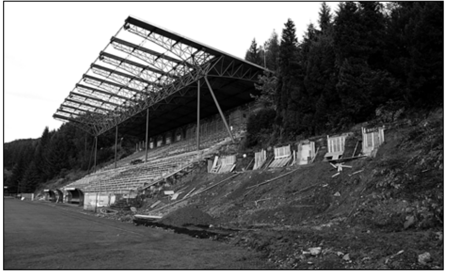
Stavebné práce na opornom múre a pätkách na uchytenie novej tribúny sektoru hostí – jún 2014.

búne riadiaci velín, komentátorské miesta, miesta pre médiá.