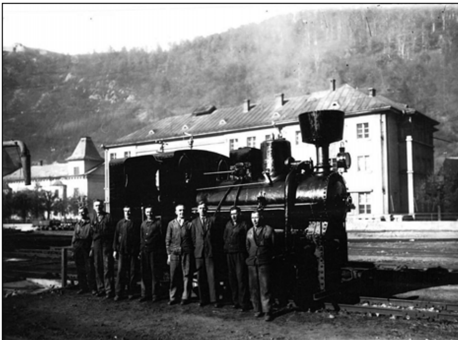
Lokomotíva vyrobená v roku 1902. Na snímke v popredí opravárenská čata – záber z 50 – tich rokov minulého storočia.