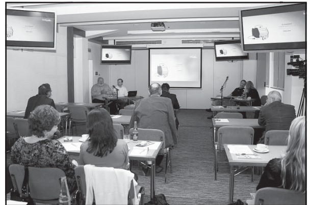
Z dvojdňového workshopu Hĺbková svalová laserová terapia pri rehabilitácii, zotavovaní a pre zvýšenie výkonnosti“, ktorého súčasťou bola prezentácia lasera novej generácie LCT 1 000.