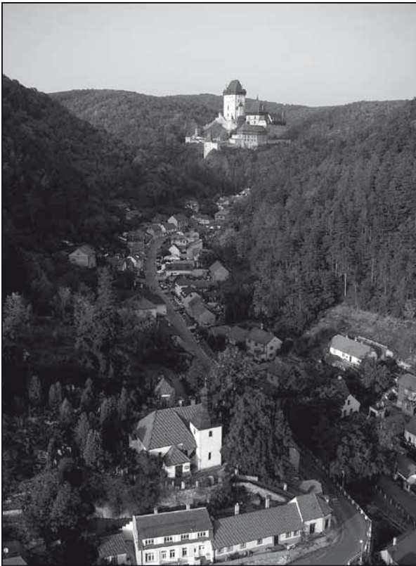
Karlštejn