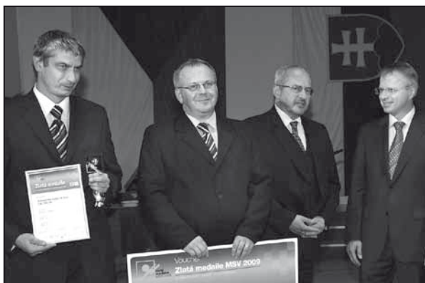
Vedenie spoločnosti ŽDAS, a.s., pri prevzatí medaily.