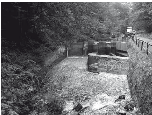
Pohľad na hať Lomníšťá

V hydroelektrárni je zabezpečený nepretržitý prevádzkový režim. Odstavená je len počas každoročnej strednej opravy, vykonávanej v priebehu septembra, t.j. v období nízkeho prietoku vody, aby došlo k čo najmenším stratám na výrobe elektrickej energie. Hydroelektrárň zasobuje voda z troch pot-