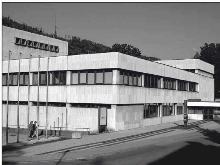
Dňa 15. októbra si pripomenieme 35. výročie od otvorenia Domu kultúry ŽP v Podbrezovej.