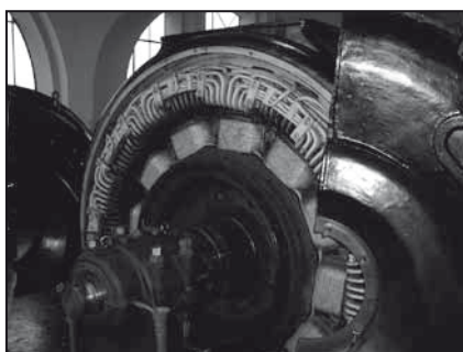
Pohľad na generátor G2

kov - Biele vody, Bauková a Lomníšťá, na ktorých sú umiestnené stavidlá. Tieto hate usmerňujú a regulujú prietok vody, vedenej podzemnými privádzacími do podzemnej zbernej nádrže - vodojemu na „Rígli“. Zo zbernej nádrže voda preteká tlakovým potrubím, s výškovým spádom 196 metrov, do hydroelektrárne s dvomi Peltónovými turbínami TG1, TG2 (s hydraulickým regulátorom otáčok). Turbíny poháňajú dva generátory, s inštalovaným výkonom 3 450 kVA. Vyrobená elektrická energia je prostredníctvom rozvodne vysokého napätia vyvedená do 22 kV vzdušnej linky, ús-